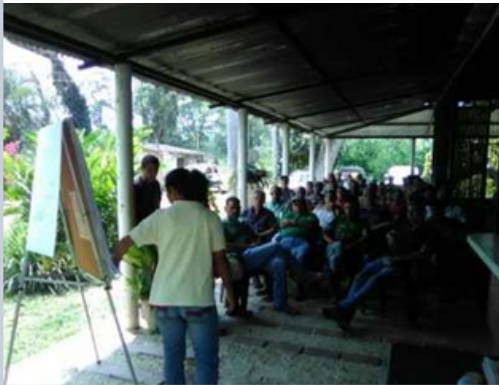
TALLER 1: GENERALIDADES DEL CACAO